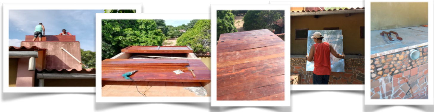
Montage van de deksels bovenop de watertoren van het gastenverblijf.