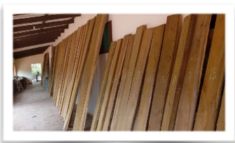
Het geleverde hout wat staat te drogen voordat het geschaafd kan worden.