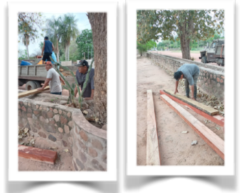
De zware planken en balken worden met de hand gelost.

Op dit moment wordt het deksel voor het grote reservoir bij het bogenhuis gemaakt, wat een hele klus is. Later zal hierover ook een afdak gemaakt worden. De Diaconie van de protestante kerken uit Haarlem hebben voor de deksels financiële steun verleent. Waarvoor onze dank!